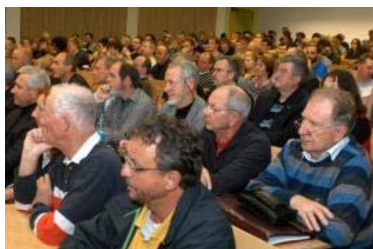
Spannt auf den Eröffnungsvortrag: Gefüllt war der Hörsaal zum Auftakt des 25. Darmstädter Sport-Forums.

Beispiel Sportstätten: Die Frage nach Angemessenheit stellt sich immer intensiver. »Der geometrische, rechteckige Raum, für die Sportkultur des 20. Jahrhunderts prägend, ist nicht mehr angemessen.« Multifunktionalität heißt das Gebot. Die Inflation von reinen Fußball-Stadien, ohne Sicherung der Finanzierbarkeit und Nachhaltigkeitskonzept,